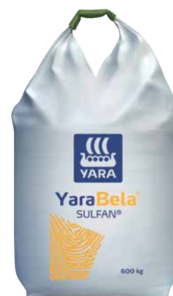
YaraBela® SULFAN® (24 % N + 15 % SO 3 )